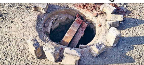
तोशाम । मुख्य मार्ग पर हादसों को न्यौता दे रहे सीवर के मैनहोल।

अनजाने में किसी भी समय कोई बड़ा हादसा घटित हो सकता है, क्योंकि यह गड्ढा कस्बे के मुख्य चौक में शुमार सुरेंद्र सिंह चौक पर सड़क के बीचो-बीच बना हुआ है। काबिले गौर होगा कि प्रतिदिन इसके बिल्कुल नजदीक से प्रशासन तथा संबंधित विभाग के अनेक अधिकारी,