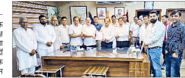
भिवानी। मांगों को लेकर शिक्षा बोर्ड के चेयरमैन को मांगपत्र सौंपते हुए।