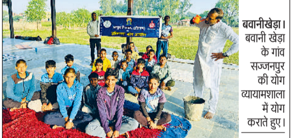
भवानीखेड़ा । भवानी खेड़ा के गांव सज्जनपुर की योग व्यायामशाला में योग कराते हुए।

के समक्ष सार्वजनिक धर्मशाला में सुविधाजनक शौचालय का निर्माण, धूप और बारिश से बचाव के लिए धर्मशाला पर टीन शेड डलवाने की मांग रखी।