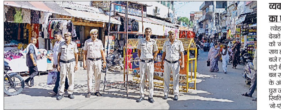
भिवानी। सराय चौपटा में बैरिकेड्स लगाकर वाहनों को रोकते पुलिसकर्मी।

त्योहारी सीजन एवं भीड़ को परेशानी से बचाने के लिए शहर थाना पुलिस पूरी तरह से अलर्ट मोड पर है। खरीददारी के लिए बाजार में आने वाली भीड़ व दुकानदारों को जाम की स्थिति से निजात दिलाने के शहर थाना पुलिस ने बाजारों के एंटी प्वाइंटों पर बैरिकेड्स कर रहे गश्त, खरीददारी लगाकर नौ नाके लगाए हैं, जिससे बाजार में ई-रिक्शा व फॉर व्हीलर की 'नो-एंट्री' हो गई है। वैसे तो सुबह 11 बजे से शाम पांच बजे तक ई-रिक्शा की बाजार में 'नो-एंट्री' की गई है, फिर भी कोई इमरजेंसी स्थिति बुजुर्ग या बीमार को एंटी में छूट दी गई है, ताकि उन्हें किसी प्रकार की परेशान न झेलनी पड़े। वहीं पुलिस राइडरों की बाजारों में व्यवस्था बनाने के लिए गश्त कर रहे हैं। इसके साथ ही शहर के सराय चौपटा, जैन चौक व बर्तन बाजार में तीन मचान बनाई गई हैं, जिस पर चढ़कर पुलिस के चलते बाजारों में भीड़ भीड़ रहती है और ई-रिक्शा व फॉर व्हीलर को भी बाजारों में प्रवेश करने से रोकते पुलिसकर्मी।