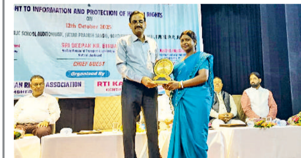
भिवानी । स्मृति चिन्ह भेंट करते सम्मानित करते अतिथि।