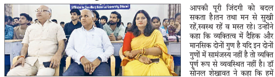
भिवानी । आयोजित कार्यक्रम में उपस्थित अधिकारी व बच्चे।