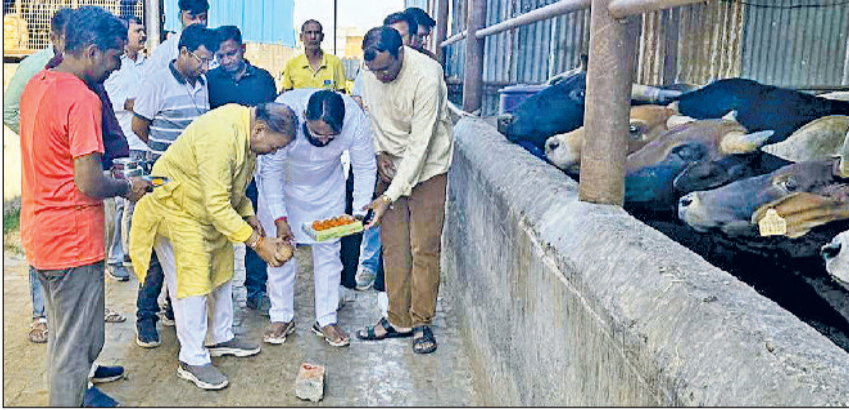
भिवानी । नारियल फोड़कर नंदीशाला के भवन के जीर्णोद्धार का कार्य शुरू करवाते हुए।